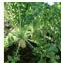
Fertilizantes e produtos para plantas