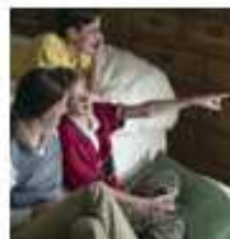
Roupas de Cama, Mesa e Banho