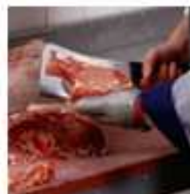
Carnes e produtos de origem animal