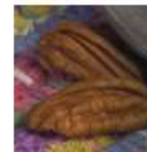
Nozes e oleaginosas