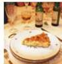
Alimentos processados, étnicos e de delicatessen