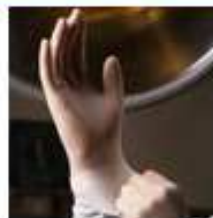
Borracha e derivados