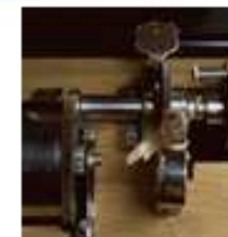
Equipamentos e componentes eletrônicos