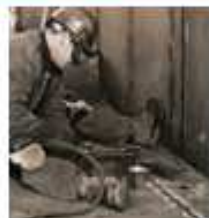
Metal e produtos metálicos